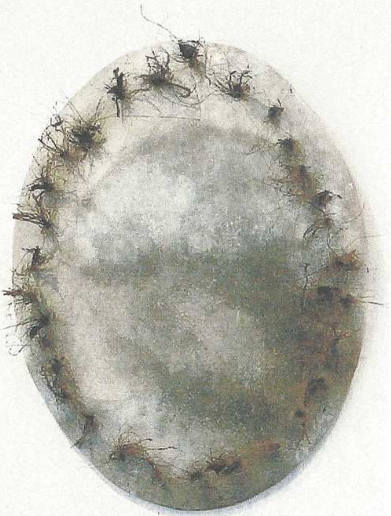
Schwäbische Topf, Öl auf Leinwand Ralf Kaiser 2011