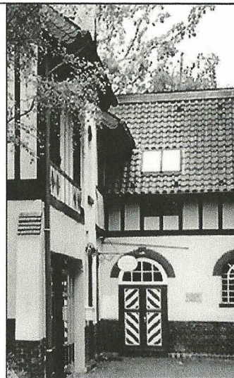
Haus Hildener Künstler Hofstraße 6 40723 Hilden